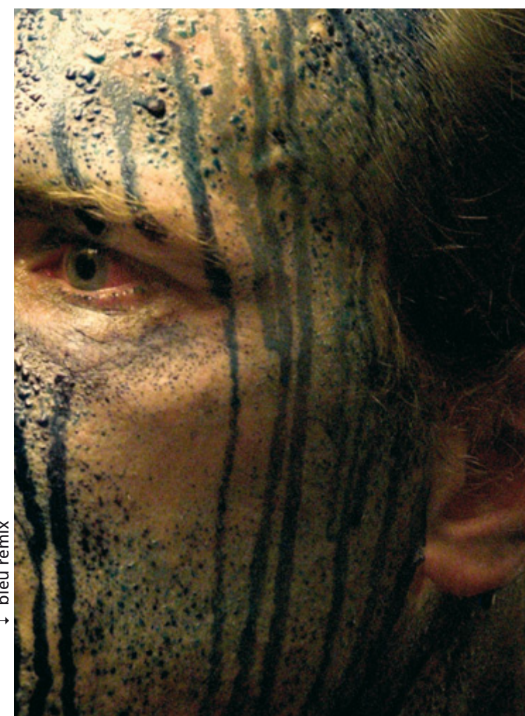
↓ bleu remix

Das Gastspiel von Schaulplatz international wurde ermöglicht dank der Unterstützung von PRO HELVETIA