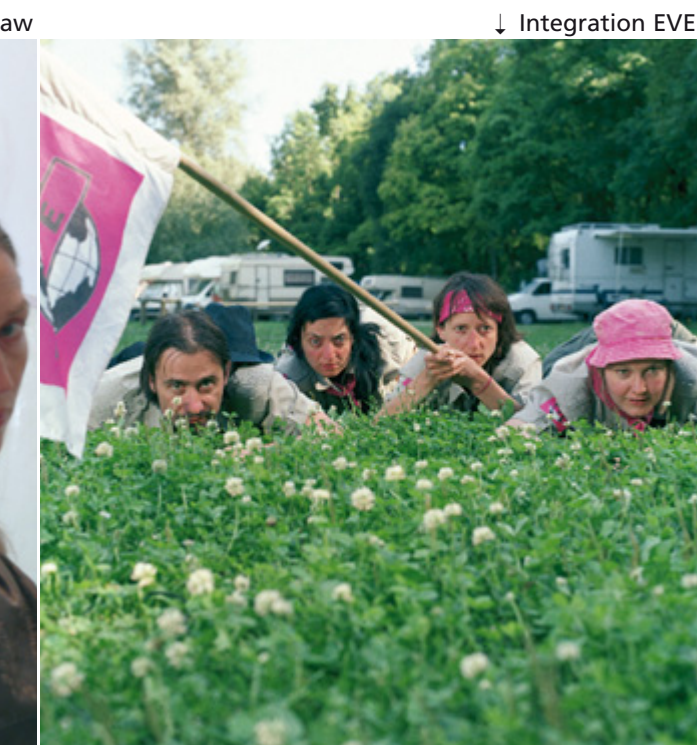
↓ Integration EVE