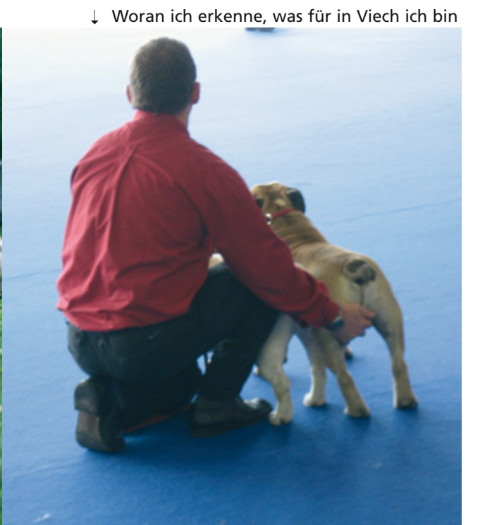
↓ Woran ich erkenne, was für in Viech ich bin