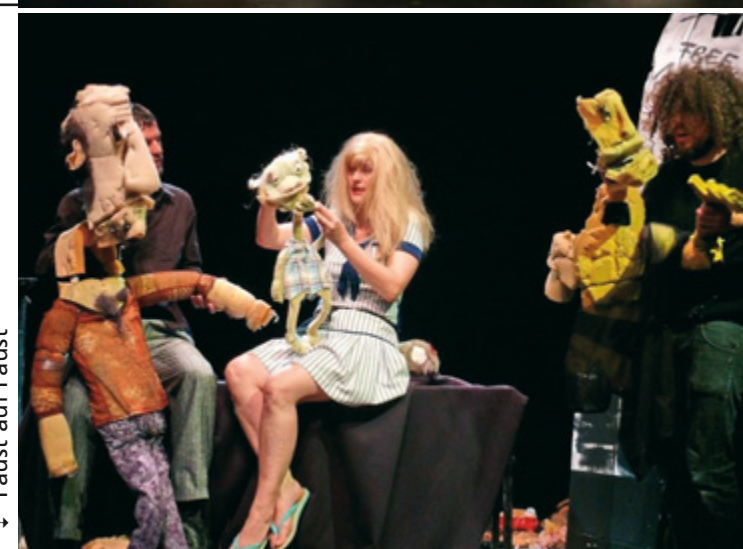
↓ Faust auf Faust

In Kooperation mit den schauspielFrankfurt. Mit freundlicher Unterstützung des Goethe-Instituts und des Auswärtigen Amtes.