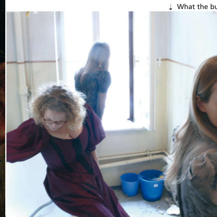
↓ What the building saw

nehmen Gäste und Gastgeber Bauarbeiten am gemeinsamen kulturellen, sozialen, geografischen, architektonischen und ökonomischen Umfeld. Die Veranstaltung steht in direkter Folge des Symposiums Zur Förderung der Darstellenden Kunst des Kulturreferats und ist die vierte der Ökumenischen Theaternächte am PATHOS. Teilnahme für geladene Gäste und nach Anmeldung, telefonisch (089-12111075) oder per Mail (info@pathostransporttheater.de)